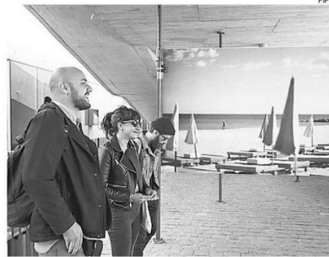
VISITAS GUIADAS EN EL PARQUE CULTURAL DE VALPARAÍSO.

Además de las visitas guiadas, hoy se inaugura la Exposición Fotográfica colectiva