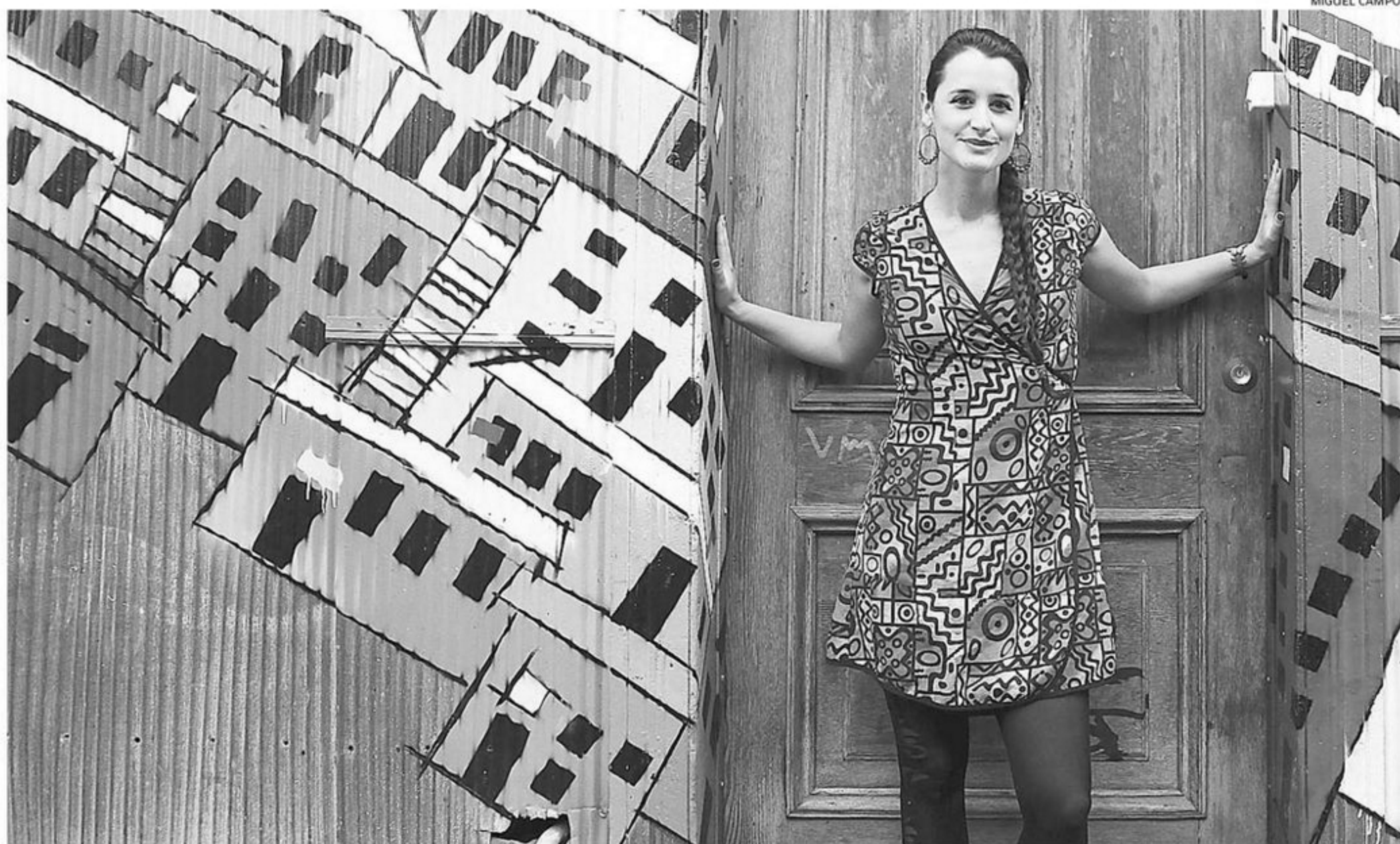
LA CANTANTE CHILENA LANZÓ SU NUEVO DISCO, "REY LOJ", QUE CONTIENE 14 CANCIONES CON UNA VARIADA MEZCLA DE SONIDOS LOCALES Y LATINOAMERICANOS.

Según recordó, la figura de Rey Loj nació a partir del juego de palabras con reloj y em-