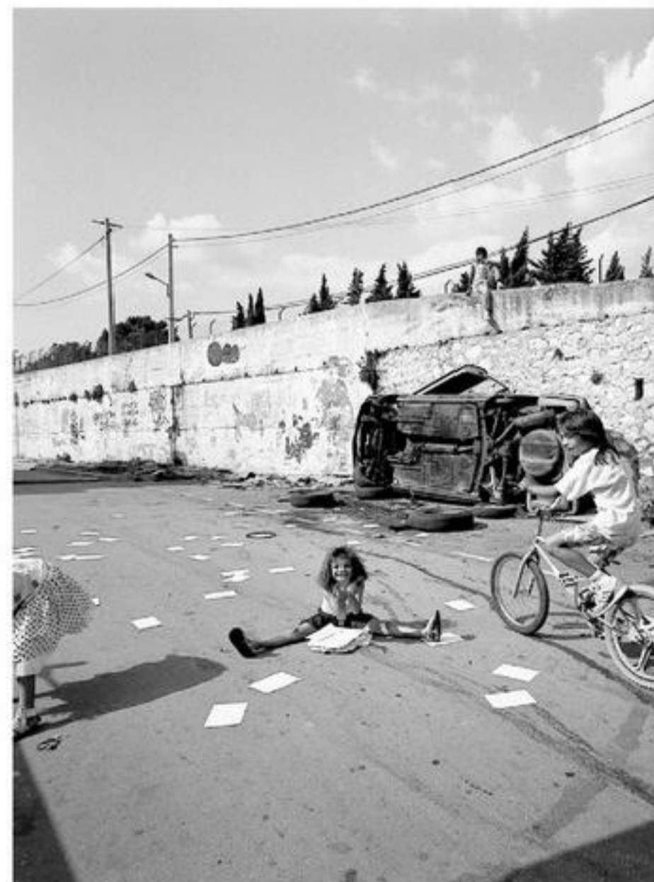
▶▶ Detalle foto de Gilles Favier, Marseille quartier nord , 1991. FOTO: GILLER FAVIER

"El festival responde a la inquietud de entender nuestra época desde la fotografía. Nos gustaría funcionar todo el año, dejar un legado permanente", dice el director. Ya lo están logrando. El año pasado, el Festival de Arles, el más importante del mundo, le regaló al FIFV 850 fotolibros, que ahora serán exhibidos y que en el primer semestre de 2015 conformarán un biblioteca de consulta pública en la Casa Espacio, ubicada en calle Buenos Aires 824, que espera seguir creciendo. ●