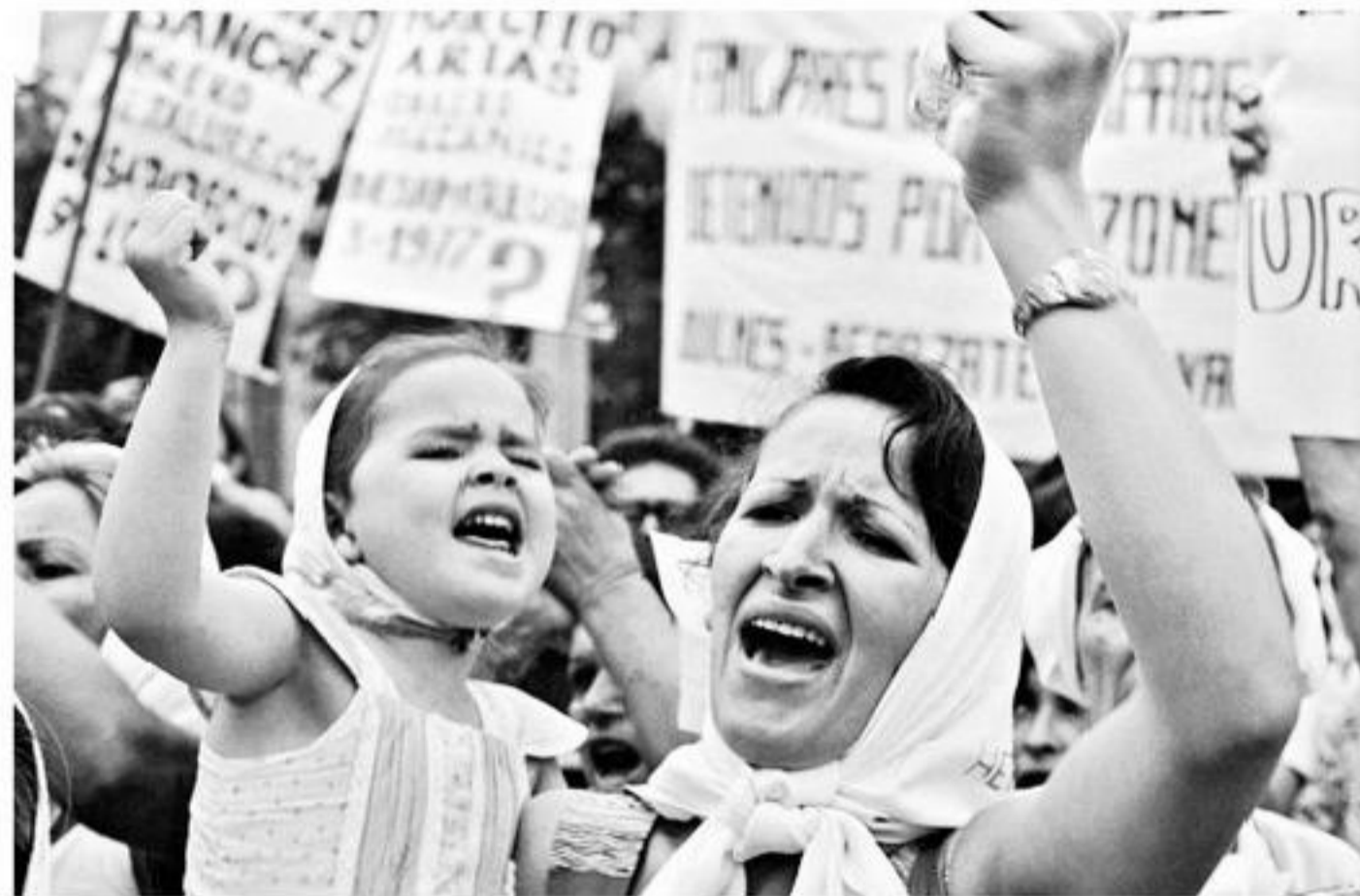
▶▶ Madre e hija, Plaza de Mayo, Argentina (1982).

Este domingo, de 15 a 18 horas, se tomarán fotos antiguas al público en el PCV. También se exhibirán los resultados de la Fotomaratón, donde ciudadanos comunes toman fotos. Más datos en: www.fifv.cl .