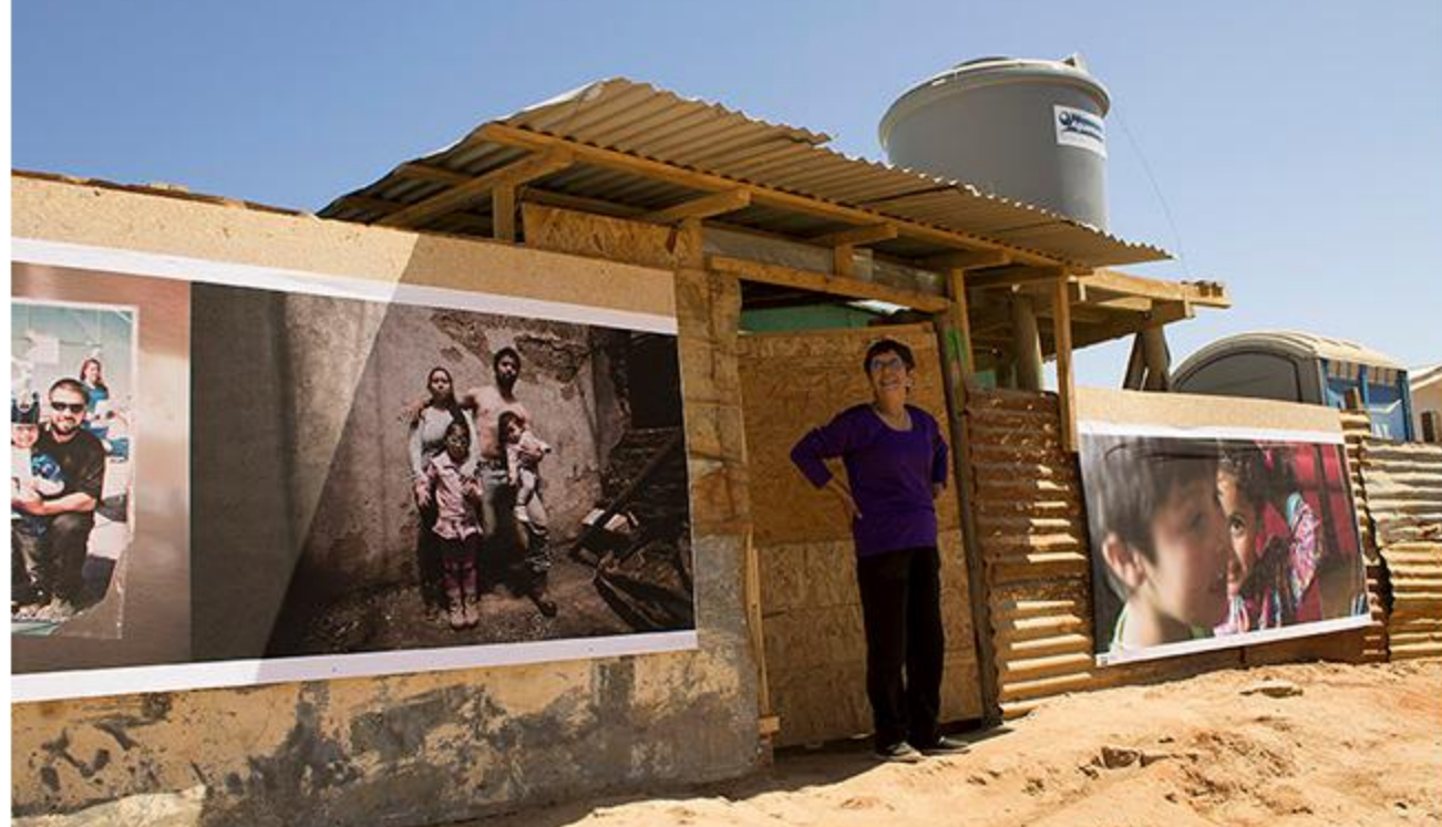
FIFV 2014