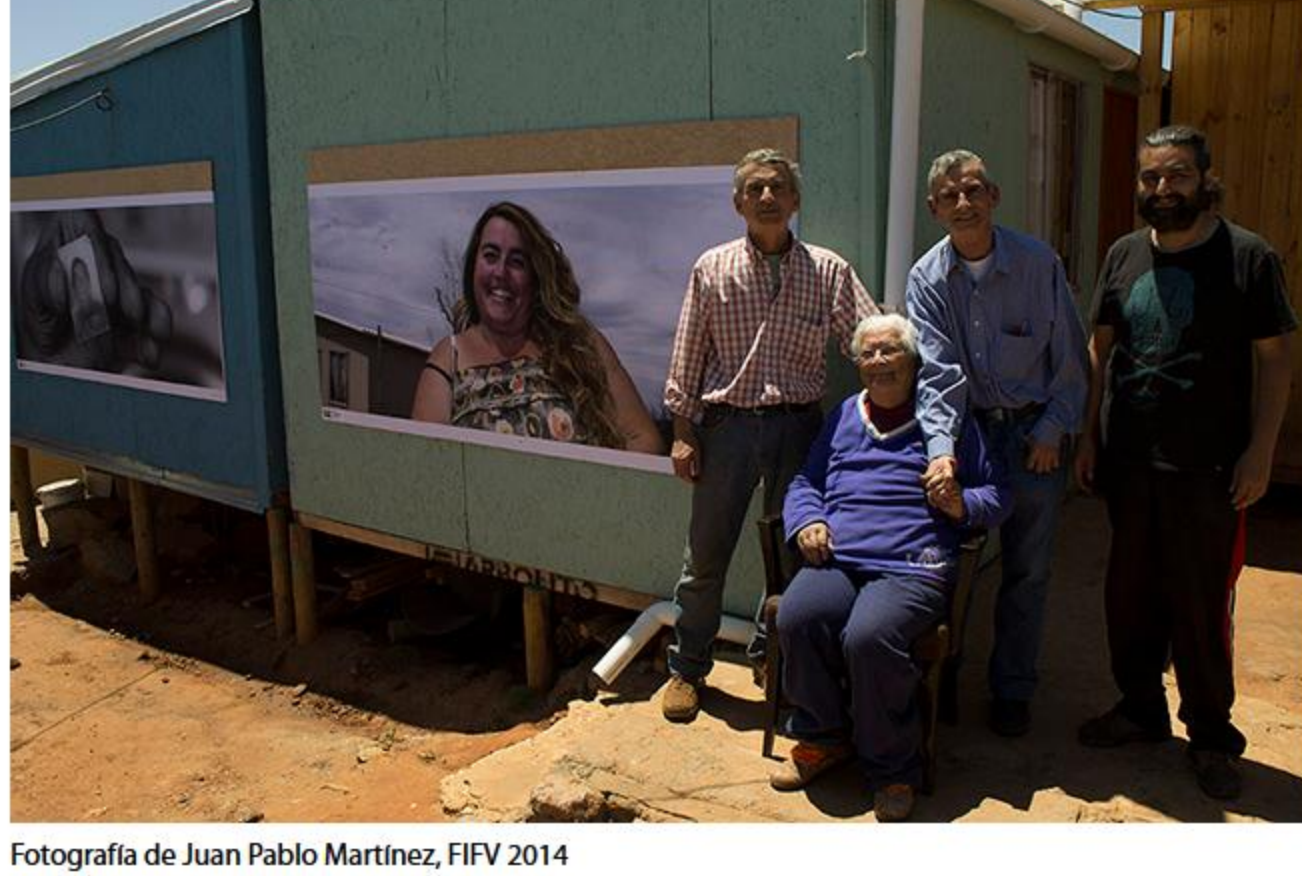
FIFV 2014