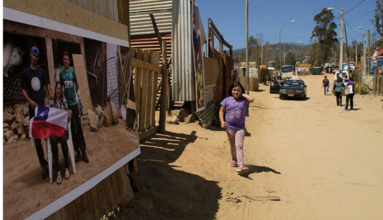
FIFV 2014