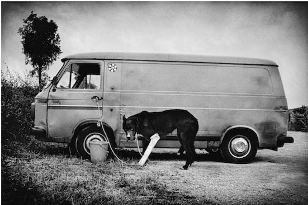
Rome, 2005

Exceptionnellement, le FIFV organise une rencontre publique pour que le plus grand nombre puisse découvrir l'artiste et son œuvre.